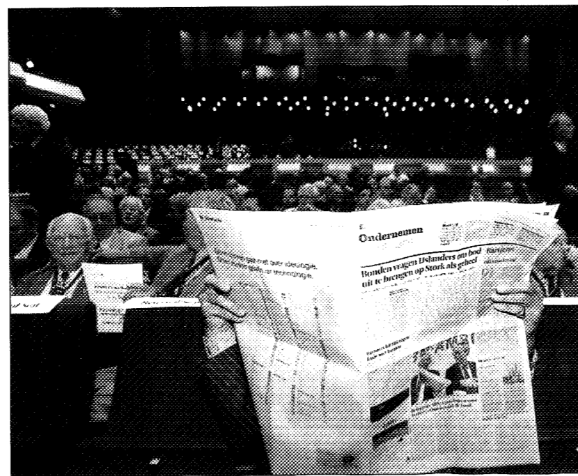
Aandeelhoudersvergadering van ABN Amro. Het is te kort door de bocht om de crisis tot vereenvoudigen tot zedeloos handelen.

De politieke en maatschappelijke verontwaardiging over het bonussysteem zoals die rondwaart in ons land en elders, kan niet liggen in de grondgedachte: prikkel mensen met geld om tot betere prestaties te komen. De pijn zit elders, namelijk bij het toekennen van een bonus bij slechte prestaties. Dan komt de 'graai-cultuur' in zicht en wordt duidelijk dat de bonus buiten zijn oorspronkelijke bedoeling en functie fungeert. Maar ook hier is enige nuance op z'n plaats. In veel gevallen wordt door degene die de bonus vaststelt en door degene die de bonus ontvangt, de bonus niet meer als extra gezien, maar als onderdeel van de beloning. De verontwaardiging richt zich in zo'n geval